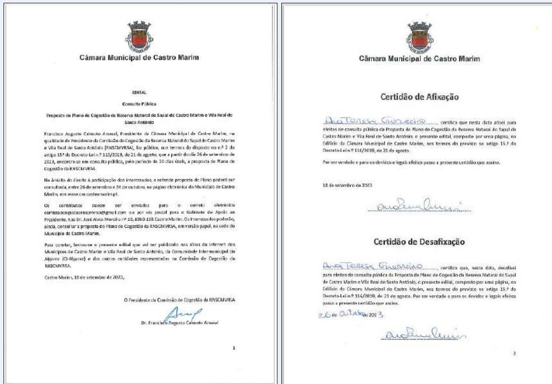
Figura 1 - Edital para consulta pública da Proposta de Plano de Cogestão da RNSCMVRSA

A Proposta de Plano de Cogestão da RNSCMVRSA foi publicitada por edital no dia 18 de setembro de 2023 ( Figura 1 ), de acordo com e-mail remetido pelo Presidente da Comissão de Cogestão aos restantes membros ( Figura 2 ), e entrou em consulta pública no dia 26 de setembro de 2023, pelo período de 20 dias úteis, com término a 24 de outubro de 2023, de acordo com o estipulado no n.º 2 do artigo 15.º do Decreto-Lei n.º 116/2019, de 21 de agosto.