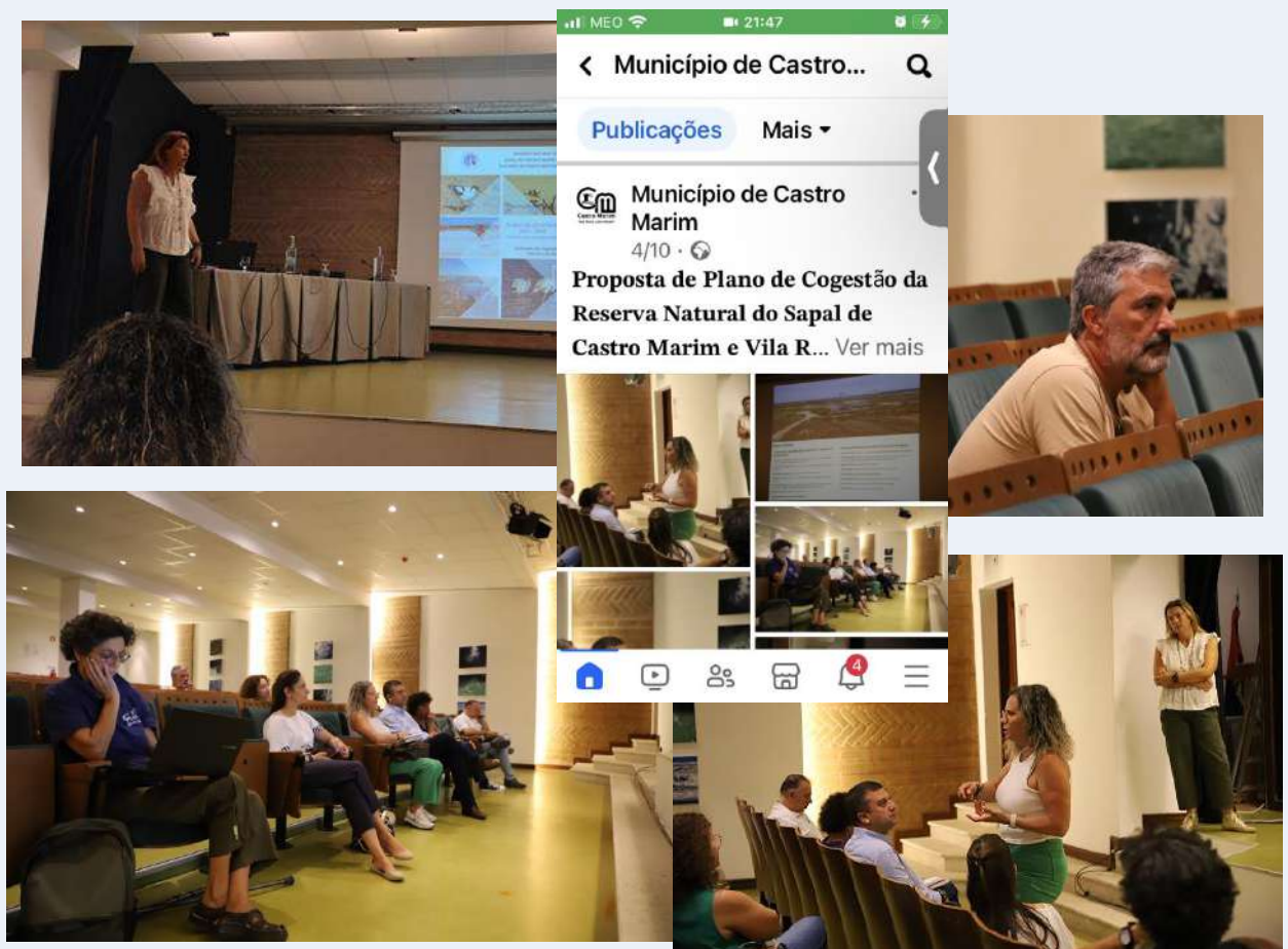
Figura 6 - Fotos da sessão participativa de apresentação da Proposta de Plano de Cogestão da RNSCMVRSA na Biblioteca Municipal de Castro Marim e respetiva divulgação no sítio da Internet do Município de Castro Marim