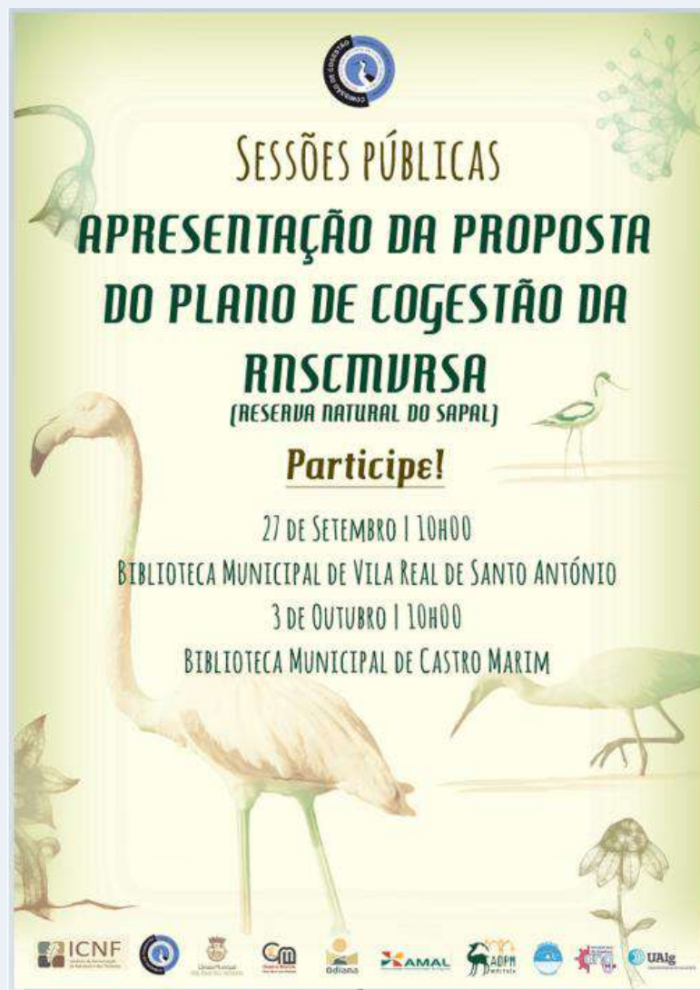
Figura 3 - Cartaz de divulgação das sessões participativas de apresentação da Proposta de Plano de Cogestão da RNSCMVRS

As sessões foram divulgadas através das redes sociais e sítios de internet das entidades que integram a Comissão de Cogestão, junto com a divulgação do edital.