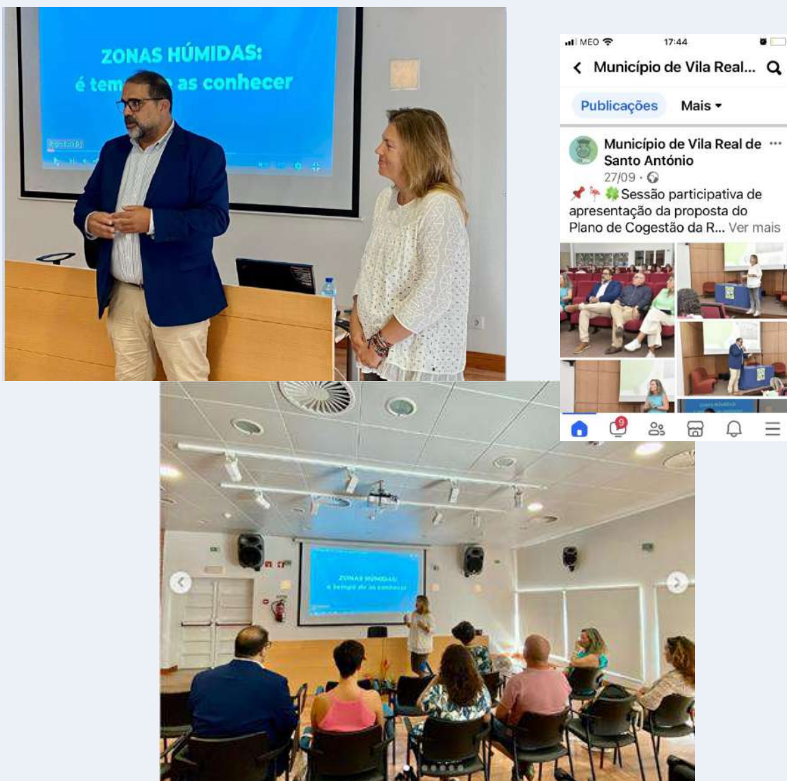
Figura 4 - Fotos da sessão participativa de apresentação da Proposta de Plano de Cogestão da RNSCMVRSA na Biblioteca Municipal de VRSA e respetiva divulgação no sítio da Internet do Município de VRSA

Participaram nas duas sessões um total de 8 pessoas, para além dos elementos organizadores (5 na sessão realizada em VRSA e 3 na sessão realizada em Castro Marim). As listas de presença encontram-se em anexo a este Relatório (Anexo II).